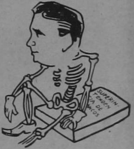
Murió contra su voluntad.