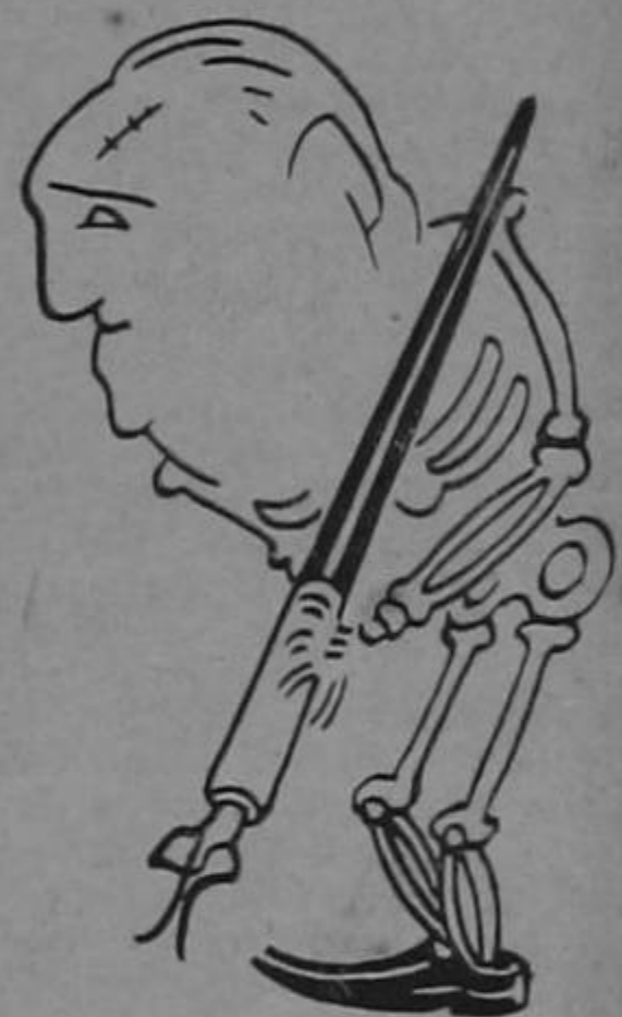
EL GENERAL PINAUD

Luchó con heroico civismo y al fin y al cabo ganó. (Bueno, pero ¿no murió? ¿No es esta su tumba? No; es la tumba del brochismo).