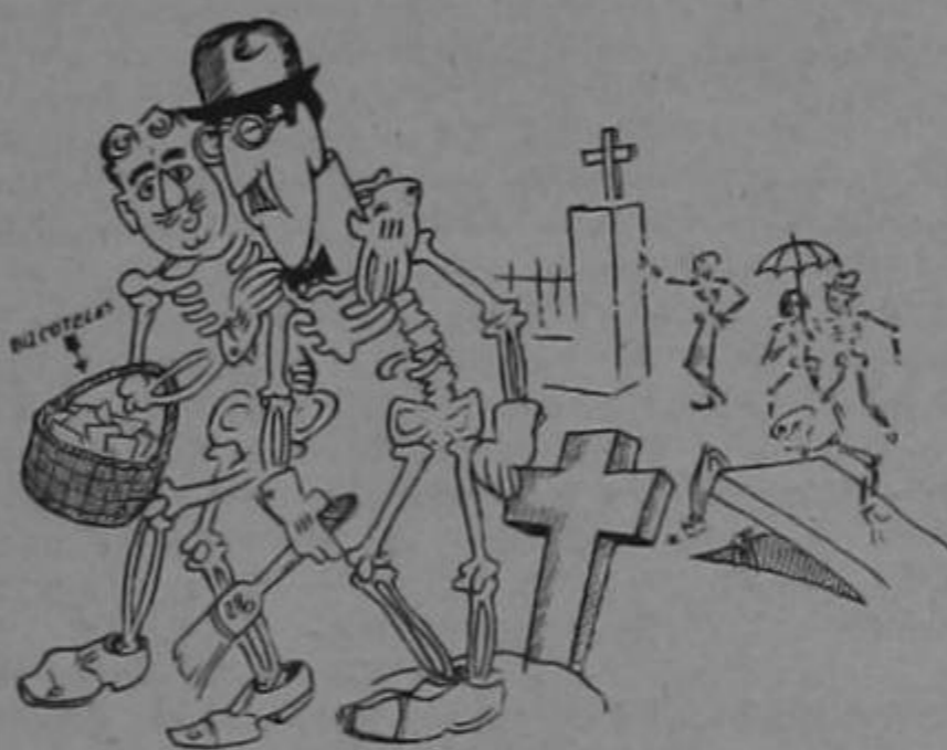
A falta de pan, buenas son bizcotelas.

LOS MALES COMUNICADOS SUELEN SER MEJOR LLEVADOS