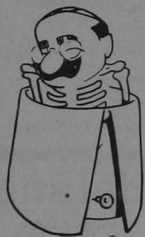
¡Tipitipitón! ¡Tipitipitón! ¡Tipitipitón!